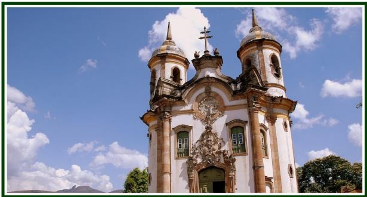
Церковь Святого Франциска Ассизского в городе Ору-Прету, Бразилия

Будучи свободными от оков и избавленными от мёртвого груза догматических толкований, личных имён, антропоморфных понятий и наёмных священников, фундаментальные доктрины всех религий окажутся тождественными в эзотерическом смысле.