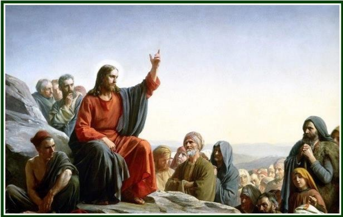
Образ пророка из Назарета

..... Мы имеем в виду тех [христиан], чья вера в их соответствующие церкви чиста и искренна, а также тех, чья безгрешная жизнь являет славный пример того пророка из Назарета, устами которого дух истины громко говорил с человечеством. Такие были во все времена.